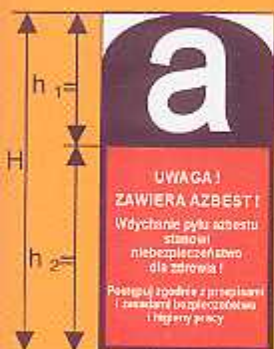
Rys. 1 Obowiązujące oznakowanie pomieszczeń, w których znajduje się azbest.

Jeżeli tylko istnieje takie podejrzenie, najlepiej jest jak najszybciej skontaktować się z właścicielem nieruchomości lub z urzędem gminy bądź powiatu w celu uzyskania informacji o dalszym postępowaniu oraz spowodowania, aby właściciel nieruchomości podjął działania zabezpieczające zgodnie z obowiązującymi przepisami.