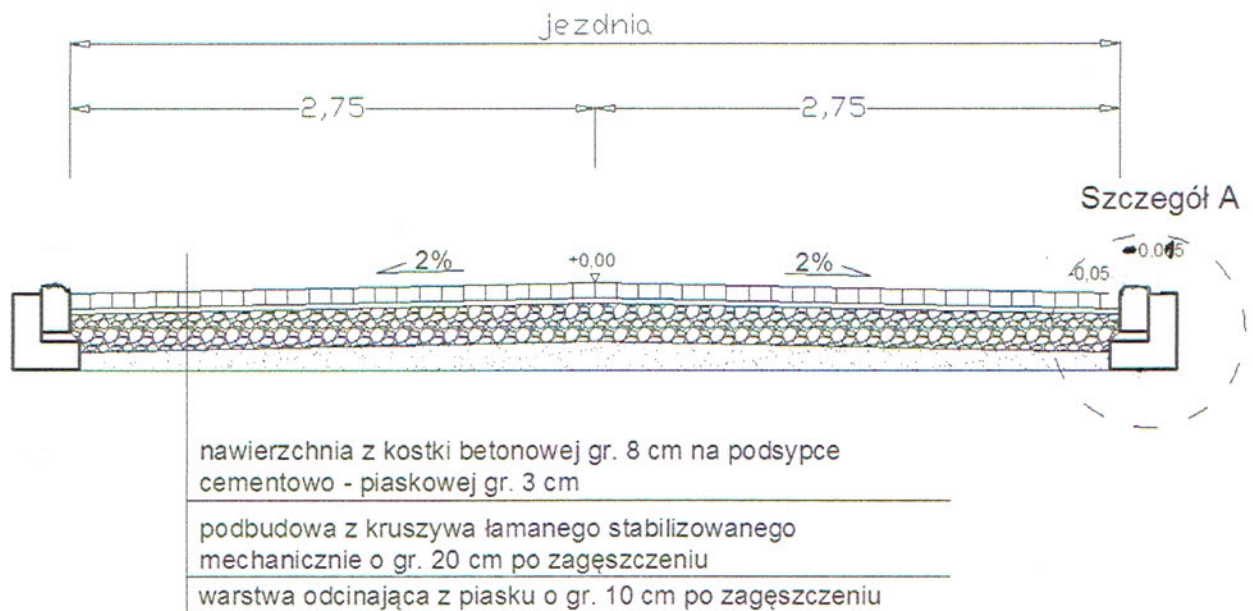
Rys. 2. Szczegół A (krawężnik uliczny 15x22 cm)