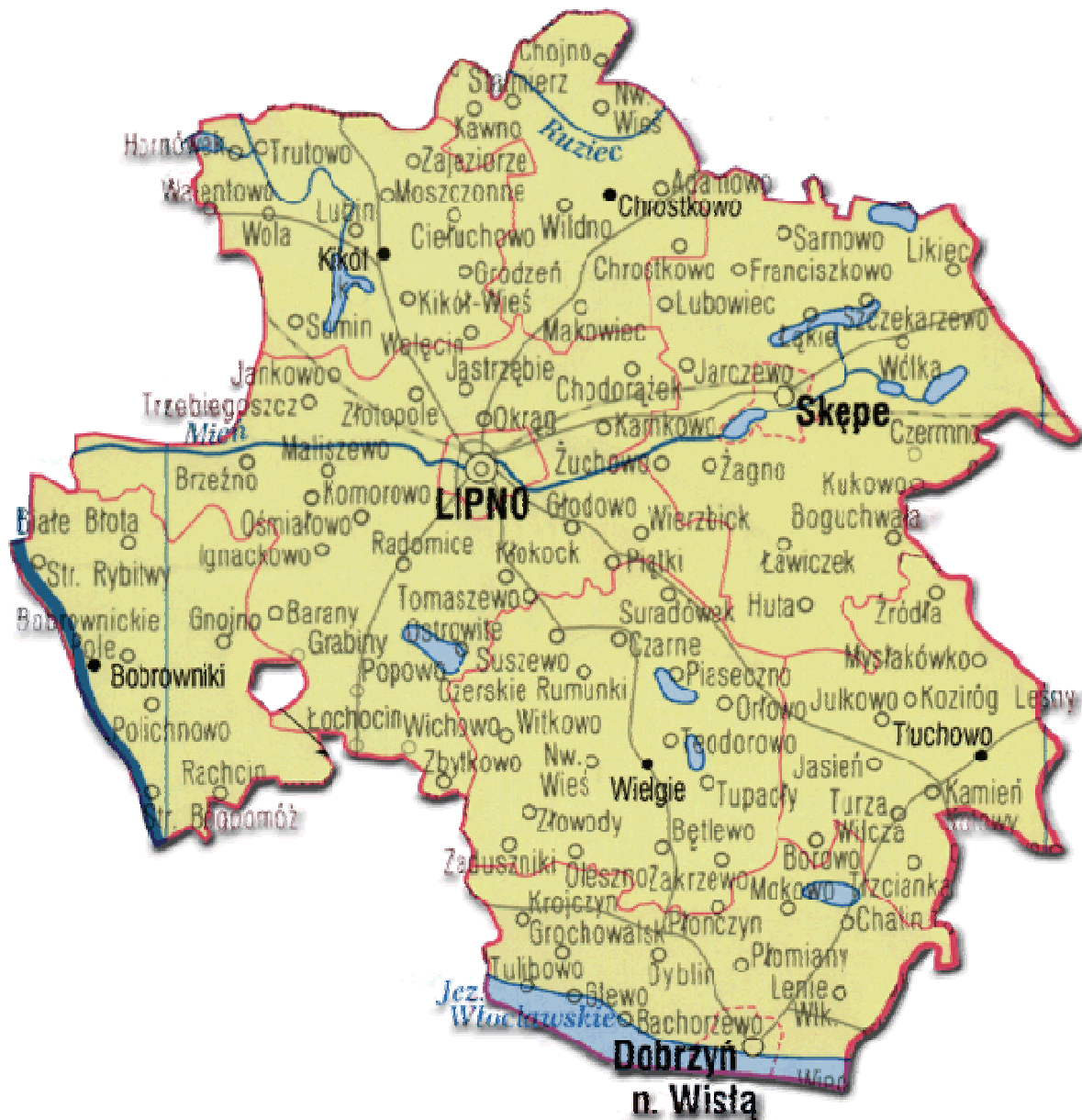
Miasto Lipno oraz sąsiadujące miejscowości.